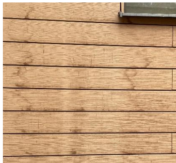
Obr. 2 Vodní prachové skvrny